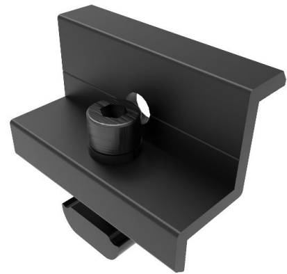
VISTA EN PERSPECTIVA