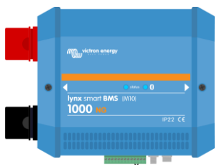
Lynx Smart BMS NG 500 A y 1000 A