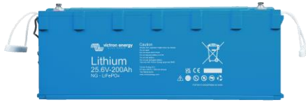
Batería Lithium NG 25,6 V 200 Ah