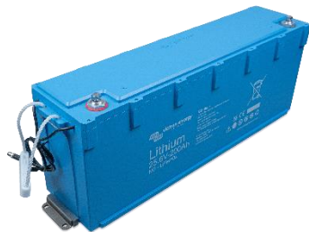
Asegurada con soportes de montaje