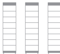
3 x HVM+ 22.1