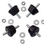
SILENTBLOCKS A-35 (4 unidades)