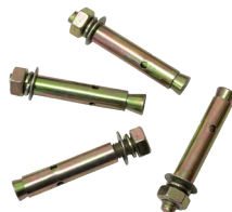
TACOS DE EXPANSIÓN Tornillería metálica (4 unidades)