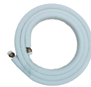
TUBERÍA DE COBRE FRIGORÍFICO 3 metros y 5 metros