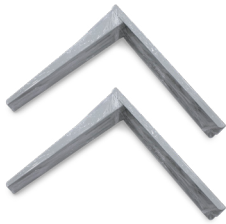
UN JUEGO DE SOPORTE 450x500x50mm (2 unidades) Espesor de 1,8 mm