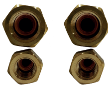
TUERCAS Tuercas de conexión abocardada