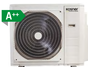
MODELOS: KSTI-M4 28/80N KSTI-M4 36/100N