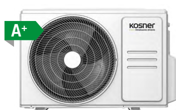
MODELO KSTI-M2 18N/50