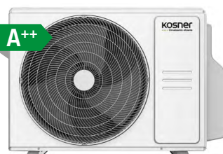
MODELO KSTI-M3 27N/79