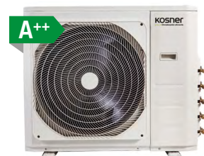
MODELO KSTI-M5 42/125N