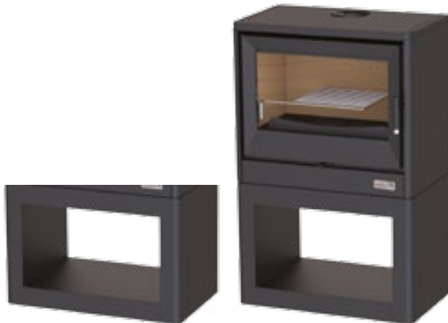
LEÑERO NEGRO GH L1