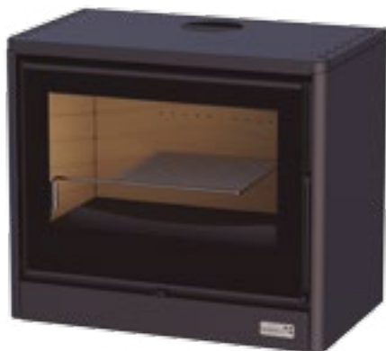
GH EST 1000 V Cristal serigrafiado en color negro.