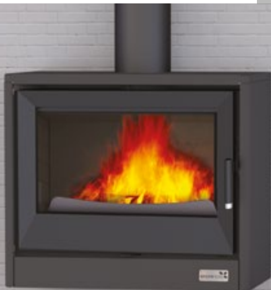
GH EST 1000

SILENCIOSA POSIBILIDAD DE DESCONEXIÓN DE LA TURBINA.