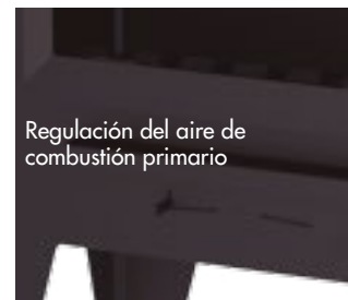
Regulación del aire de combustión primario