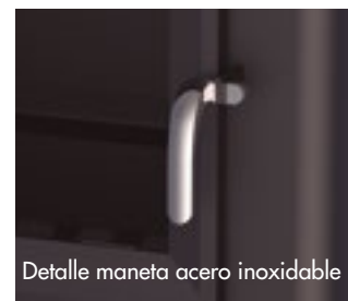
Detalle maneta acero inoxidable