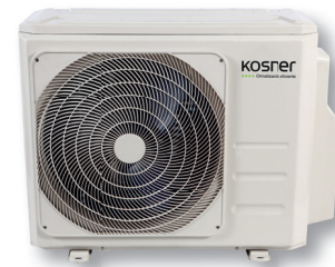
KSTI M3-24/71 NOVA