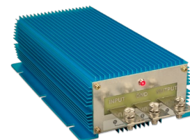
Orion IP67 24/12-100 Orion IP67 12/24-50